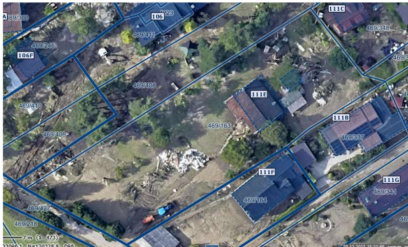
Slika 1 Ortofoto takoj po poplavih avgusta