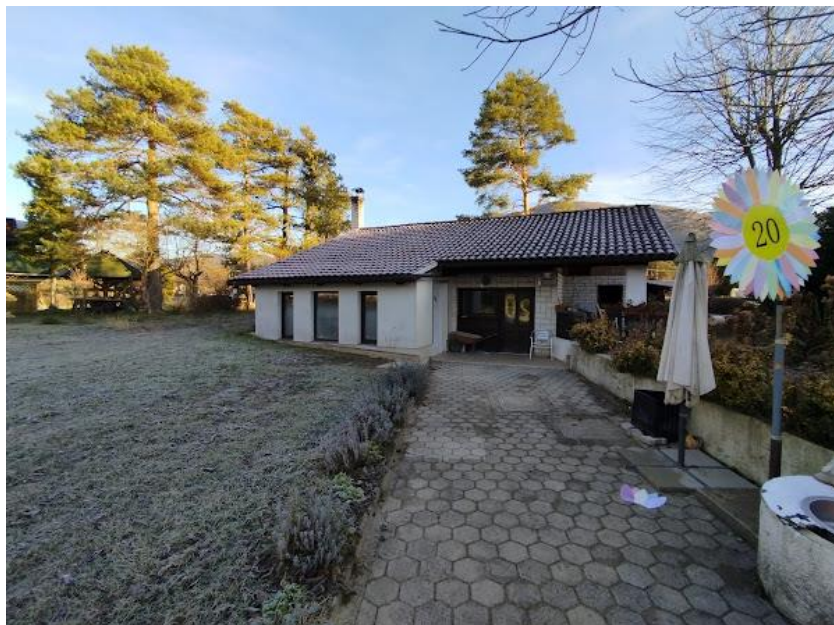
Slika 2 Pogled iz JZ