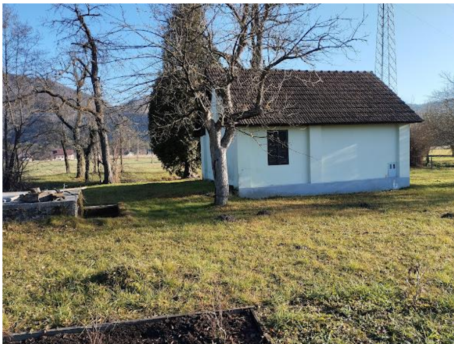
Fotografija 3: Pogled iz smeri Z