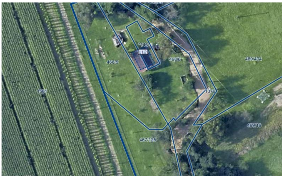
Fotografija 1: Ortofoto takoj po poplavih avgusta