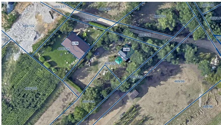
Fotografija 1: Ortofoto takoj po poplavah avgusta