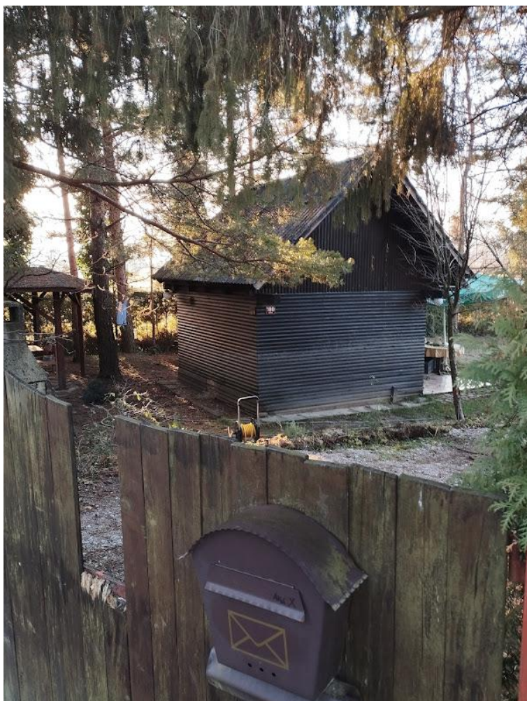
Fotografija 2: Pogled iz smeri S