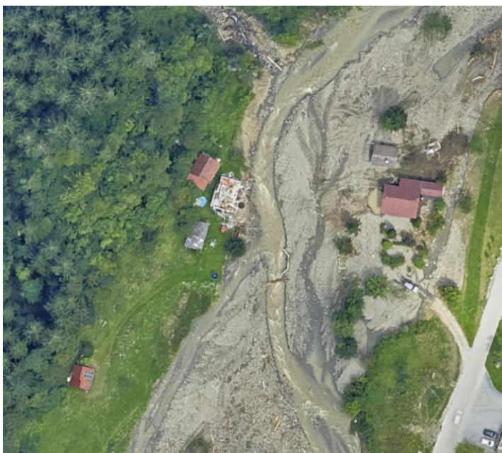
Slika 1: poplavljeno območje na dan 4.8.2023

Obravnavani objekt so v neurju 4.8.2023 prizadele poplave. Objekt se nahaja na desnem bregu reke Ljubnice. Zaradi rušilne moči reke, ki je poplavela objekt in silne erozijske moči, ki je spodjedel temeljna tla objekta, je prišlo do izpada nosilnega in polnilnega ostenja v pritličju, ter njegove porušitve.