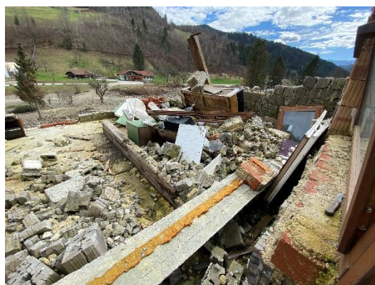
Slika 2 in 3: Porušen objekt

Sanacija objekta bi zahtevala njegovo temeljito rekonstrukcijo, v okviru katere bi bilo potrebno poseči, utrditi ali nadomestiti vse nosilne elemente objekta. Objektu bi bilo namreč po veljavnem gradbenem zakonu (GZ-1) potrebno zagotoviti mehansko odpornost in stabilnost v celoti skladno z današnjimi standardov. To bi zahtevalo posege v temelje, nosilne stene, povečini z izvedbo novih nosilnih elementov, novih stropov, strešne konstrukcije in strehe, posledično pa bi bilo potrebno izvesti tudi celotno finalizacijo objekta.